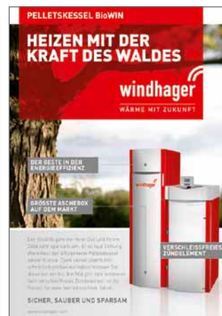
Abb.: Beispielanzeigen aus IKZ-HAUSTECHNIK