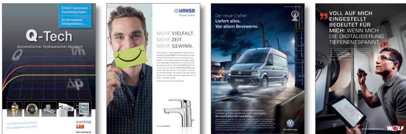
Abb.: Beispielanzeigen aus IKZ-HAUSTECHNIK

Testen Sie die Werbewirkung Ihrer Anzeige im Wettbewerb - mit dem Copytest der IKZ-HAUSTECHNIK!