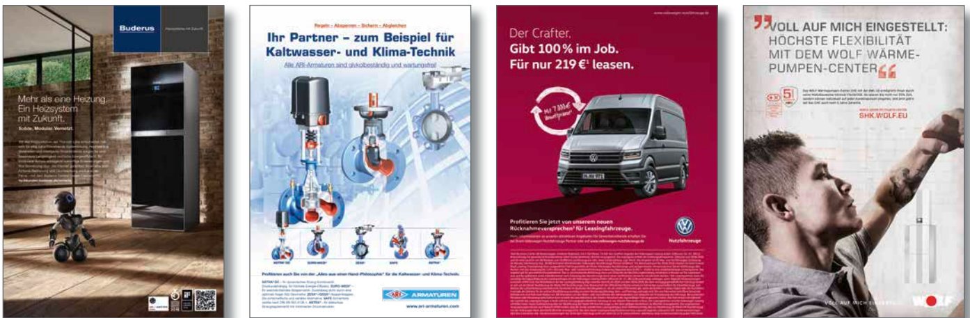
Abb.: Beispielanzeigen aus IKZ-HAUSTECHNIK

Testen Sie die Werbewirkung Ihrer Anzeige im Wettbewerb – mit dem Copytest der IKZ-HAUSTECHNIK!